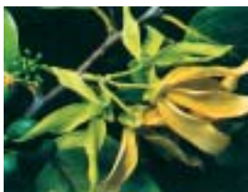
Ylang-Ylang (balinesisch «Sandat»)

Bitte respektieren Sie die einheimischen Sitten: Zeigen Sie sich nicht nackt oder «oben ohne» am Strand.